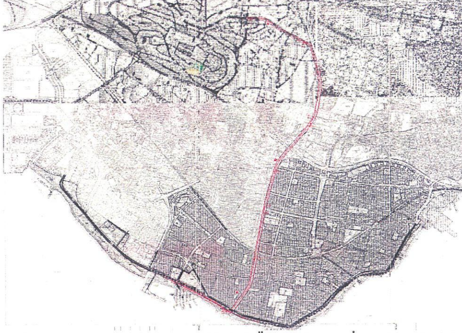
Plan Değişikliği Alanının Yürürlükteki 1/5.000 Ölçekli Nazım İmar Planı'ndaki Konumu

Tramvay hattı, Yürürlükte bulunan 1/5000 ölçekli Nazım İmar Planında, "Park Alanı" kullanım kararında, "Birinci Derece Yol", "İkinci Derece Yol" güzergahında yer almakta olup, tramvaya hizmet edecek trafo yerleri ise "Park ve Yeşil Alan", "Çocuk Oyun alanları (Bahçe+Park)" kullanım kararında kalmaktadır.