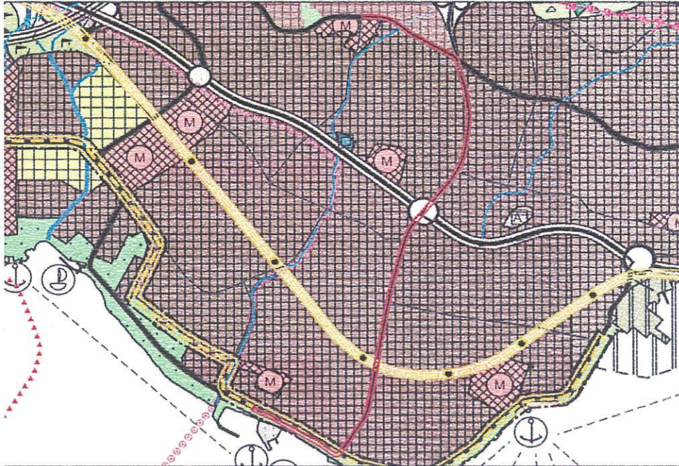
Plan Değişikliği Alanının Yürürlükteki 1/25.000 Ölçekli Çevre Düzeni Planı'ndaki Konumu

Büyükşehir Belediye Meclisimizin 12.09.2012 tarih ve 05.843 sayılı kararı ile uygun görülerek onanan ve 08.05.2018 tarihli değişiklik ile son halini alan 1/25.000 ölçekli İzmir Büyükşehir Bütünü Çevre Düzeni Planı'nda; "Birinci Derece Yollar", "İkinci Derece Yollar", "Hafif Raylı Sistem" güzergahlarında, kısmen "Bölge Parkı/Büyük Kentsel Yeşil Alan" kullanımlarında kalmakta olup, hattın alt kısmından "Devlet Demiryolu-Banliyö" (İzban) hattı geçmektedir.