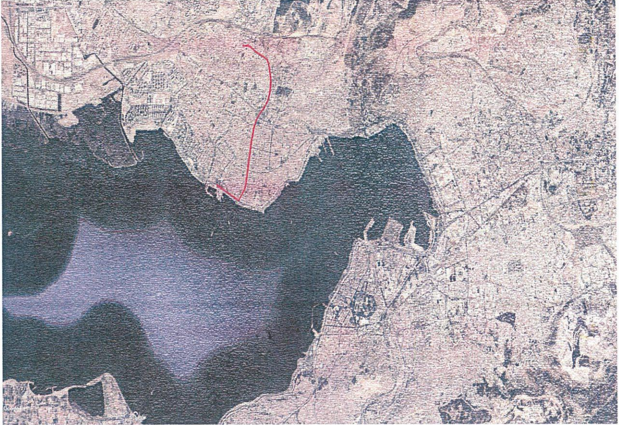
Tramvay Güzergahının Google Earth Görüntüsü

Ancak plan değişikliğine konu kısım, kıyı kenar çizgisinin kara tarafında Girne Bulvarından başlamakta ve Nazım Hikmet Bulvarı ile 7532 sokak kesişimine kadar olan bölgeyi kapsamaktadır.