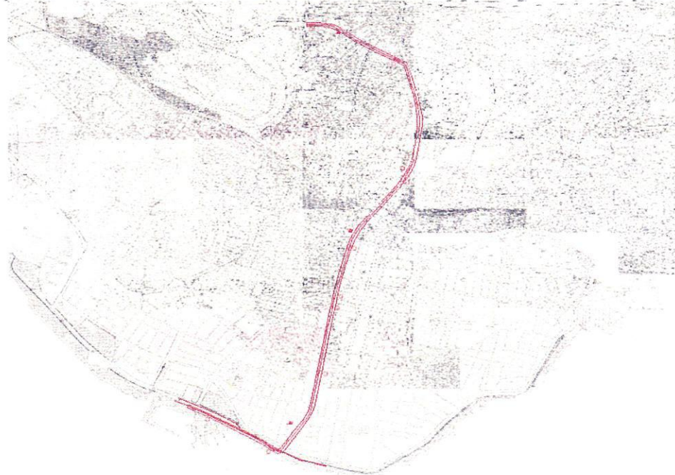
Plan Değişikliği Alanının Yürürlükteki 1/1.000 Ölçekli Nazım İmar Planı'ndaki Konumu

Yürürlükte bulunan 1/1000 ölçekli Uygulama İmar Planında, "Park Alanı" kullanım kararında, 35, 30 ve 24,50 metrelik "Taşıt Yolu" güzergahında, tramvaya hizmet edecek trafo yerleri ise "Park ve Yeşil Alan", "Çocuk Bahçesi+ Park" kullanım kararında kalmaktadır.