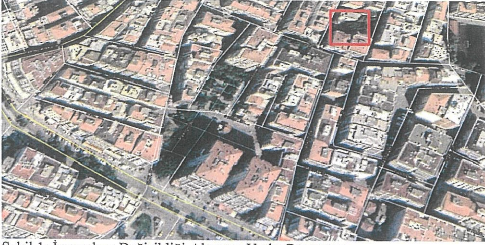
Şekil 1: İmar planı Değişikliği Alanının Uydu Görüntüsü

İmar Planı Değişikliğine konu olan, İzmir İli, Karşıyaka İlçesi, Şemikler Mahallesi,25L-2A Nolu imar paftasında bulunmaktadır.6183 Sokak ile 6238 sokağın birleştiği yeşil alanda 6.00x4.00 ebatlı, 24 m2 yüzölçümlü trafo konumlandırılmıştır.