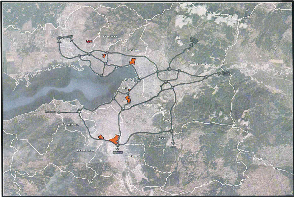
Şekil 1: Mevcut Kentsel Dönüşüm ve Gelişim Alanlarının Uydu Görüntüsü

Bu plan notu; 5393 sayılı Belediye Kanunu'nun, 5998 sayılı Kanun ile değişik 73. maddesine göre Bakanlar Kurulu Kararı ile ilan edilen ve belediyemiz yetkisinde yürütülen Kentsel Dönüşüm ve Gelişim Proje Alan Sınırlarını kapsamaktadır.